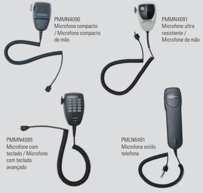
PMMN4090 Microfone compacto / Microfone compacto de mão